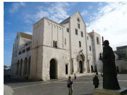
Bazylika św. Mikołaja w Bari (wł. Basilica di San Nicola ).

Postać Świętego, mimo braku wiadomości o jego życiu, jest jedną z najbardziej barwnych w hagiografii. Jego najważniejsze sanktuarium znajduje się w Bari – w południowej części Italii. Jest patronem Albanii, Grecji, Rusi, Antwerpii, Berlina, Miry, Moskwy, Nowogrodu a w Polsce: Bydgoszczy , Elbląga, Głogowa; następnie: bednarzy, cukierników, dzieci, flisaków, jeńców, kupców, marynarzy, młynarzy, notariuszy, panien, piekarzy, pielgrzymów, piwowarów, podróżnych, rybaków, sędziów, studentów, więźniów, żeglarzy, sprzedawców perfum oraz orędownikiem pojednania Kościołów Wschodu i Zachodu.